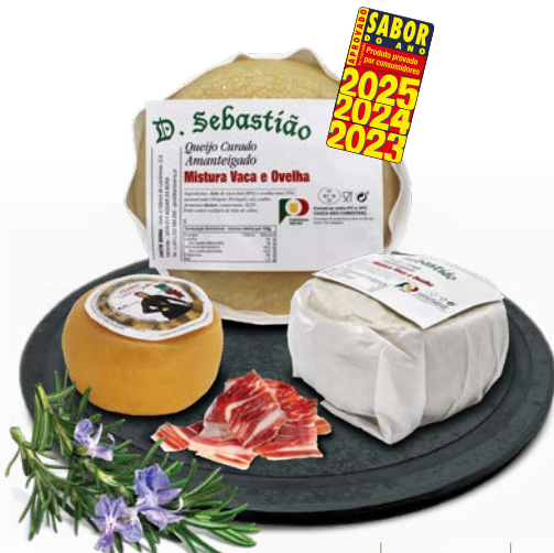
Curado Mistura Amanteigado D. SEBASTIÃO

The Buttered Mixed Cured Cheese is made from a blend of two milks (cow and sheep), featuring a soft texture and pleasant flavor. The Prolonged Cured Mixed Cheese is made from a blend of three milks (cow, sheep, and goat), with a texture ranging from semi-hard to hard, resulting from a maturation process with controlled temperature and humidity for at least 2 months. Thus, we offer cheeses matured for 2 months and 6 months. This cheese is also available in a peppery variety.