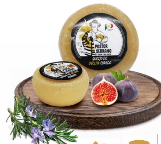
Curado Ovelha PASTOR SERRANO