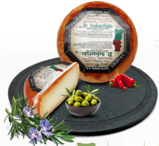
Cura Prolongada Apimentada 6 meses D. SEBASTIÃO