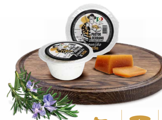
Requeijão PASTOR SERRANO