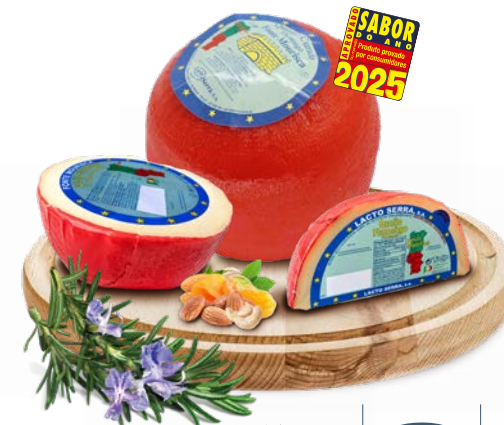
Curado Flamengo FONTE MOURISCA