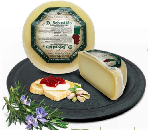
Cura Prolongada 2 meses D. SEBASTIÃO