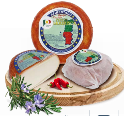
Curado Apimentado FONTE MOURISCA