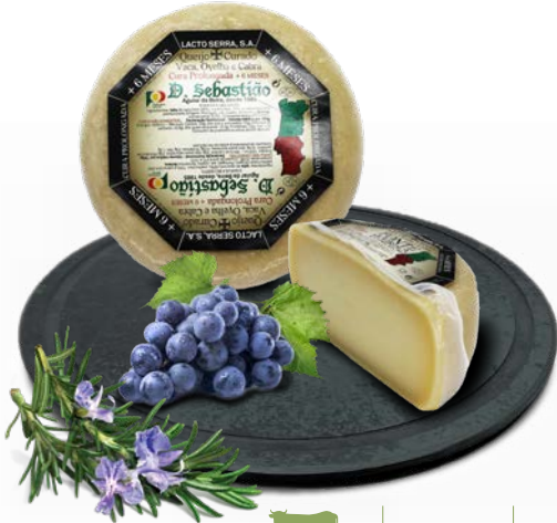
Cura Prolongada 6 meses D. SEBASTIÃO