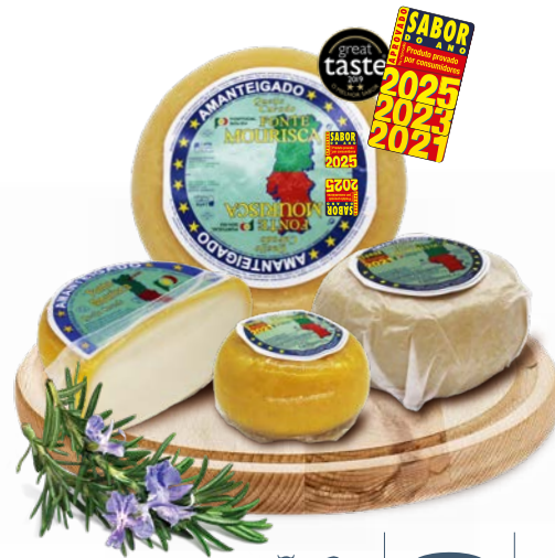
Curado Amanteigado FONTE MOURISCA

In Fonte Mourisca cheeses, we have: Buttered Cow's Cured Cheese with a Fat Content in Dry Matter (MGES) ranging from 45% to 60% and a soft, buttery texture; Peppery Cow's Cured Cheese, with the same MGES, aged for a longer period, featuring a characteristic flavor and appearance of a cheese coated in pepper; Semi-fat Cow's Cured Cheese with an MGES between 25% and 45% and a soft, creamy texture. Fonte Mourisca also offers Flamengo Ball Cheese, with its characteristic rustic shape, coated in red and soft, available in halves or quarters.