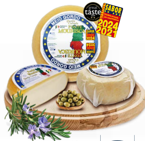
Curado Meio Gordo FONTE MOURISCA