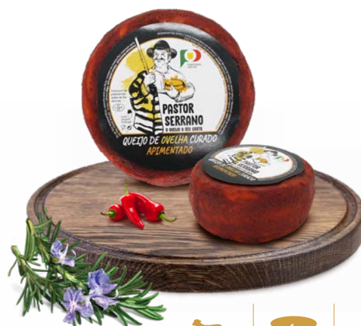
Curado Apimentado PASTOR SERRANO