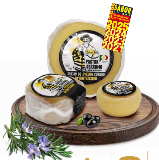
Curado Amanteigado PASTOR SERRANO